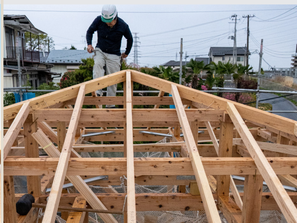
※実際の現場の写真とは異なります